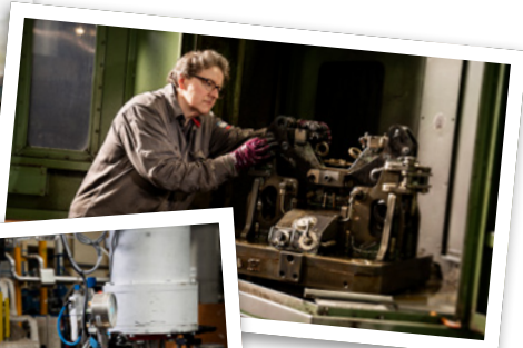
Technicien d'usinage H/F